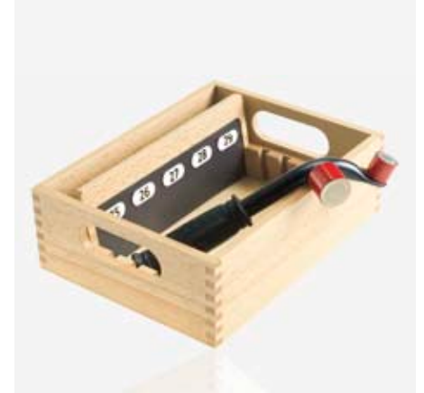
Sitznummern: Ordentlich verwahrt im Sortierkasten. Numéros des sièges : bien rangés dans la boîte. Seat numbering: tidily stored away in the storage box.