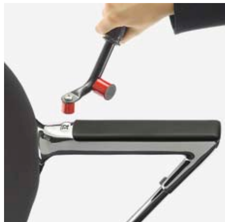
einfach austauschen mit dem Magnetgriff. et les retirer avec la poignée magnétique. simply replace with the magnetic tool.