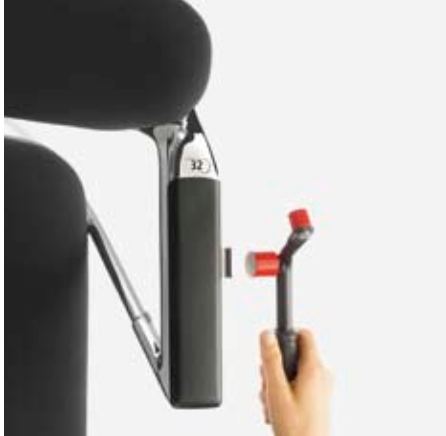
Reihenverbindung: Einfach herausziehen ... Système d'accrochage : tirer la pièce ... Linking device: simply pull out ...