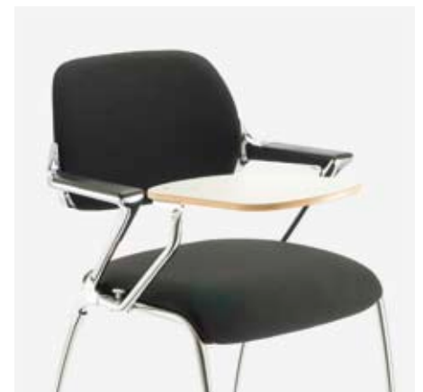
Schreibtislar: das praktische Zubehör. Tablette-écritore : l'accessoire pratique. Writing tablets: the practical accessory.