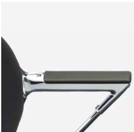
Armlehne mit Ausräusung für die Sitznummer - Accoudoir avec retrait pour insérer les numéros - Armrests with notches for the seat numbering -