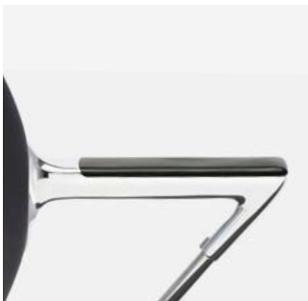
Armauflage wahlweise aus schwarzem Kunststoff ... Dessus d'accoudoirs en matière synthétique noire ... Arm-caps made from black plastic ...

Schreibtislar | Tablette-écritore | Writing tablet