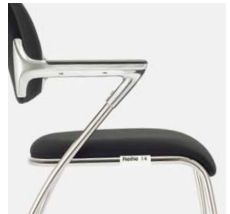
Reihennummern: Am Sitzrahmen aufzustecken. Numérotation des rangées : à clipser sur le cadre. Row numbering: can be attached to the seat frame.

Schreibtislar | Tablette-écritore | Writing tablet