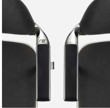
... und nach Gebrauch wieder verschwinden lassen. ... et la remettre en place après utilisation. ... and stash away after use.