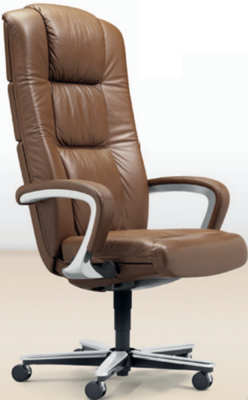
81-9462 → Lederbezug → Schubrohrabdeckung → 5-Sternfuss → Aluminium poliert