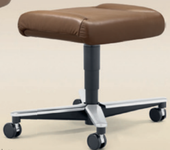
81-1261 → Lederbezug → Schubrohrabdeckung → 4-Sternfuss → Aluminium poliert → Höhenverstellbar